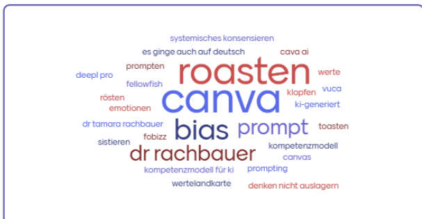
Bild Mentimeter (grk): Welche Wörter nehmt ihr (neu) mit in euren Schulalltag?

Unterricht geworden ist – und dass viele Schulleitungen mit ihren Lehrkräften aktiv nach Wegen suchen, KI reflektiert, verantwortungsvoll und gewinnbringend in ihren schulischen Alltag zu integrieren (tra).